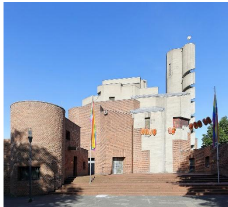
Martin Falbisoner : Chri-Auferstehungskirche

Rendez-vous à 10h45 devant l'église Christi-Auferstehungskirche, Brucknerstr. 16, 50931 Köln-Lindenthal