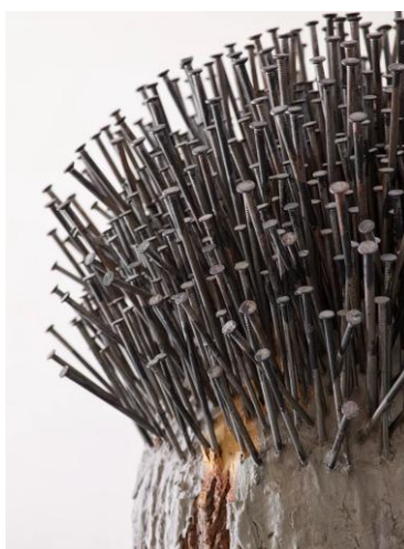
Günther Uecker, Waldgarten (3-teilig), (Detail), 2008

Rendez-vous à 11h00 à la caisse du musée muni(e) de votre billet. Arp Museum Rolandseck, Hans-Arp-Allee 1, 53424 Remagen